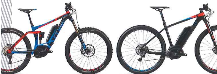
STEREO HYBRID 160 HPA ACTION TEAM 500 27.5